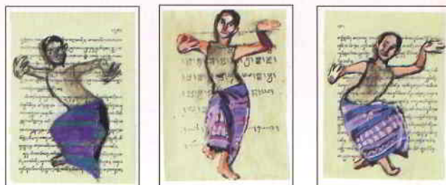
Extrait des Carnets de voyage de Titouan Lamazou, Editions Gallimard, Copyright Nouveaux Loisirs.